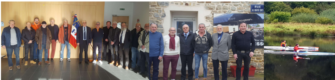
DR EB : Réunions de secteurs : le 6.01 Plougonvelin, le 27.01 Camaret..., Bureau élargi le 25.09 Châteaulin.